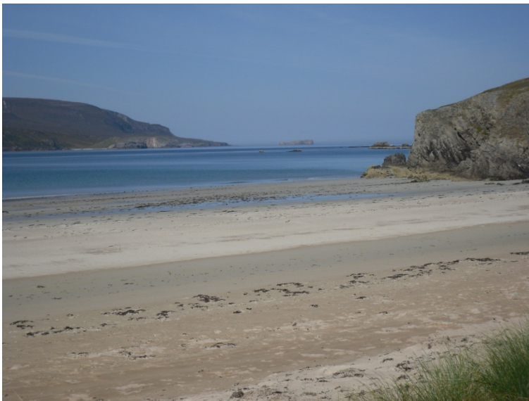
Strand von Durness

Durness mit 400 Einwohnern liegt an der Meeresenge Kyle of Durness und gehört zu den schönsten Ecken Schottlands. Hier ist das Land der Regenbogen. Entdecken Sie die Strände von Durness und Balnakeil, ein ehemaliges Hippiedorf, abgelegen an der östlichen Ecke des Balnakeil Bay. und tauchen Sie in die Welt des ( Schokoladen ) - Trüffels ein.