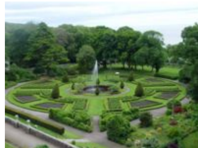
Garten von Dunrobin Castle

Der Garten ist ganzjährig geöffnet, das Schloss von April bis Oktober. In den Gartenanlagen befinden sich ein Museum mit Trophäen von Großwildjagden und eine Falknerei.