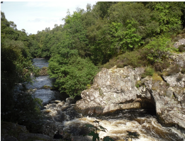
Falls of Shin

Hier besuchen Sie eine Tweed Manufaktur und im Anschluss die Falls of Shin, kleine Wasserfälle, wo man zu bestimmten Jahreszeiten springende Lachse beobachten kann. Seien Sie nicht zu erstaunt, wenn der Laden für kleine Geschenke und Mitbringsel aussieht wie Harrods in London – Das gesamte Areal ist im Besitz der Familie al Fayed.