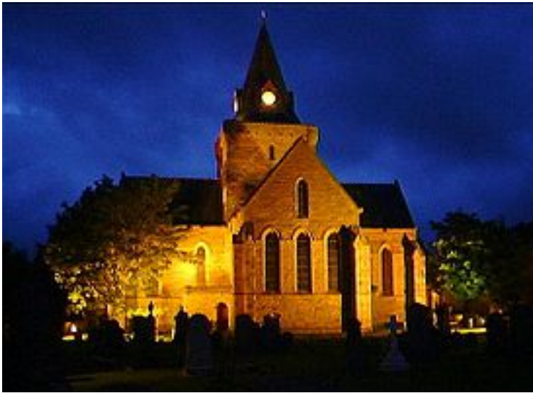
Kathedrale von Dornoch

70 km von Inverness, Richtung Norden liegt Dornoch mit seinem kilometerlangen, weißen Sandstrand und ca. 1.200 Einwohnern. In Dornoch hat 1727 die letzte Hexenverbrennung stattgefunden.