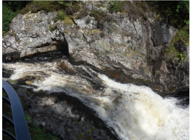
Falls of Shin

Genießen Sie danach die einzigartige Natur der schottischen Highlands und den Besuch einer Whiskey Destilliere. Ein urkundlicher Beweis für die Herstellung gibt es mit dem Jahr 1494.