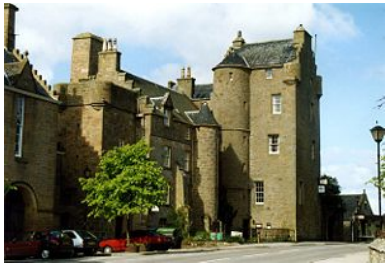
`Old Jail `von Dornoch

Die bekannte Kathedrale wurde im 13. Jahrhundert unter der Herrschaft König Alexanders II erbaut, brannte 1570 aus und wurde im 19. Jahrhundert im historischen viktorianischen Stil wieder aufgebaut.