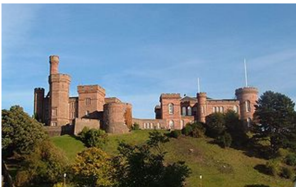
Burg von Inverness

Auf der Burg von Inverness regierte im 11. Jahrhundert Macbeth, nicht so grausam wie von William Shakespeare geschildert. Seit dem 19. Jahrhundert steht anstelle der Burg ein repräsentatives Burgschloss auf dem Hügel.